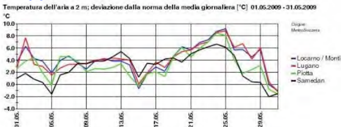
Fig. 2: Andamento della deviazione dalla norma della temperatura giornaliera per diverse stazioni durante il mese di maggio 2009. Solo pochissimi giorni hanno avuto uno scarto negativo, mentre lo scarto positivo ha localmente toccato i 9 gradi.