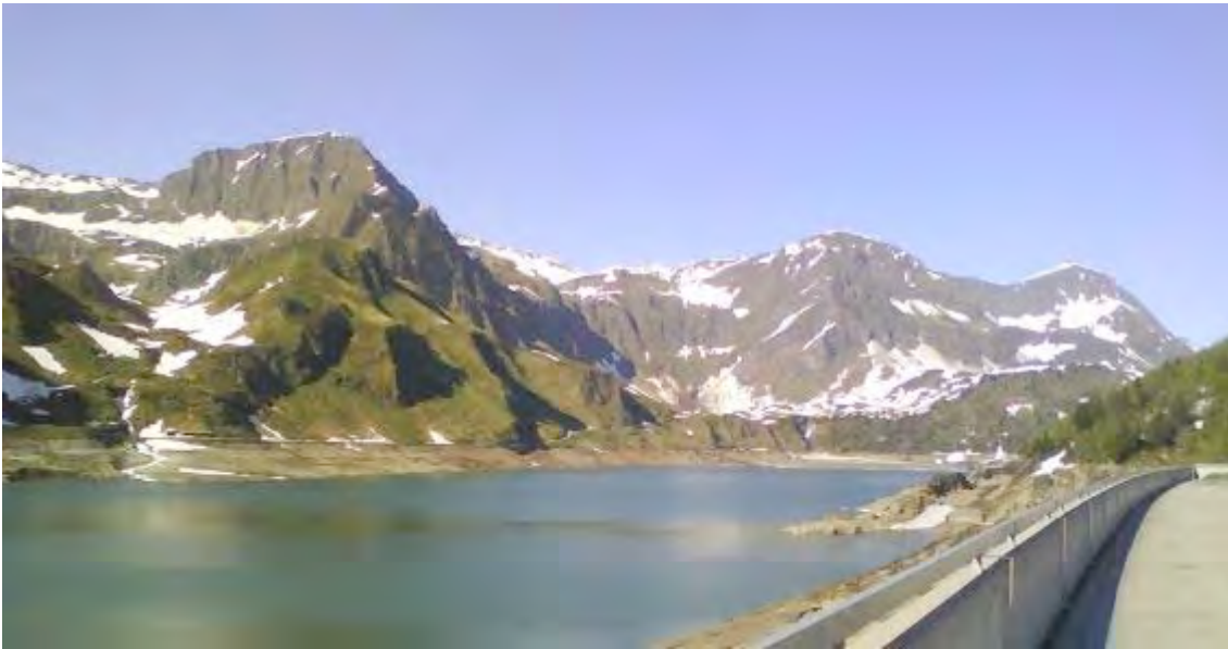
Fig. 3: Il lago del Ritom alla fine di maggio.